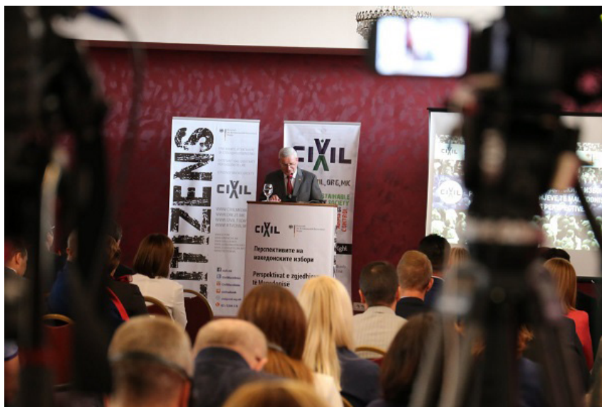
Германскиот амбасадор, еден од говорниците на Конференцијата „Перспективите на македонските избори“, 25 септември 2019

„Европа е наш дом“ е проект на ЦИВИЛ што започнува денеска и ќе трае 12 месеци, до 31 јануари 2021 година. Во овој проект, составен од низа комплементарни компоненти, ЦИВИЛ ќе спроведува мониторинг, застапување и јакнење на јавната свест во повеќе области.